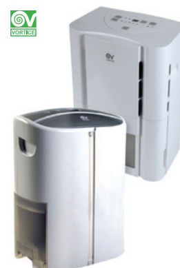
Vortice Deumido Electronic E